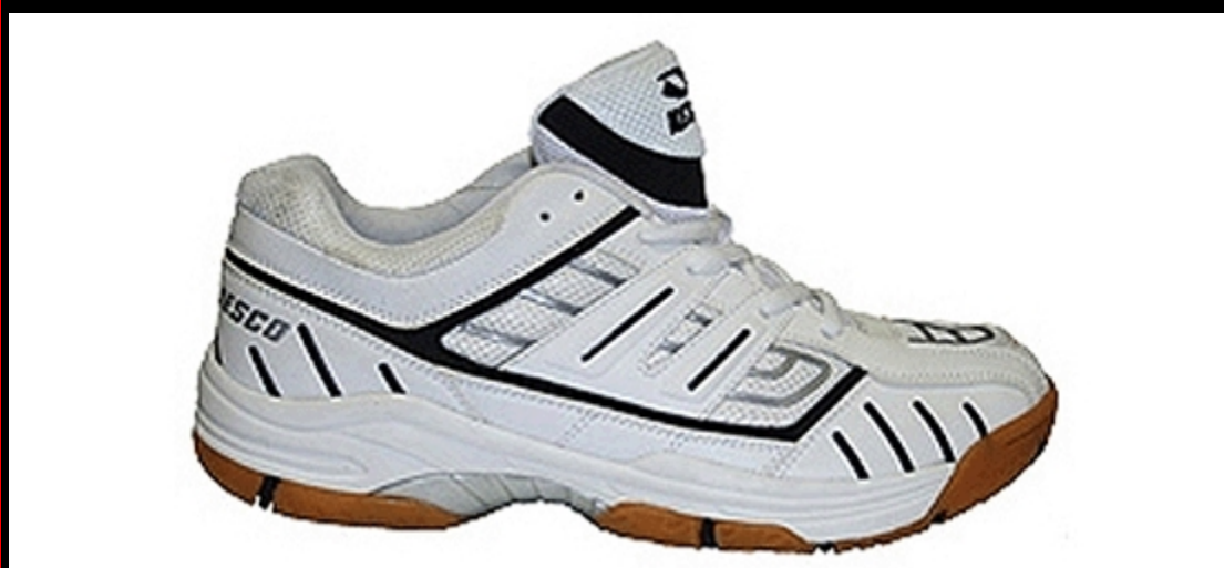
Материал: синт. кожа, сетка / износостойкая резина, Размеры: 35 - 42