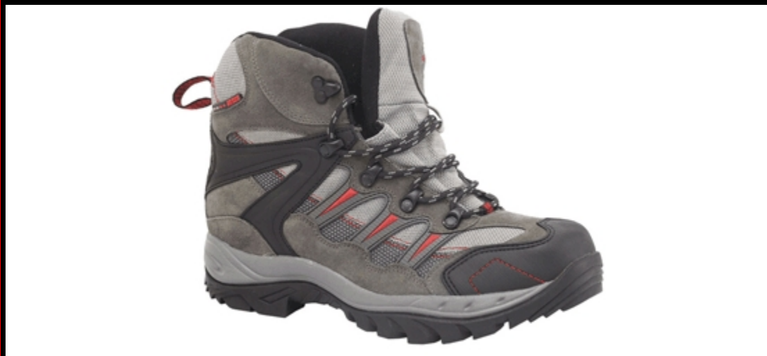
натуральный нубук, нейлон, полиэстер / износостойкая резина, Размеры: 39 - 47