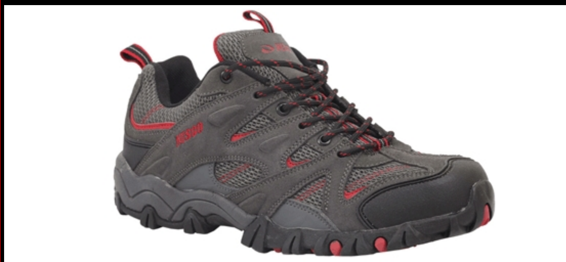
натуральный нубук, нейлон, полиэстер / износостойкая резина, Размеры: 39 - 47