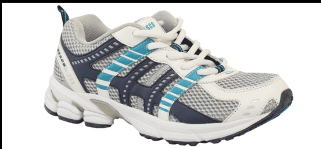
Материал: синт. кожа, сетка / износостойкая резина, Размеры: 35 - 42